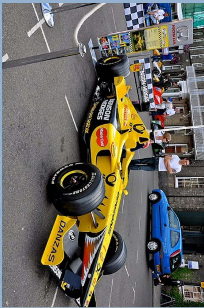
Ein gutes Rennauto? Fragen