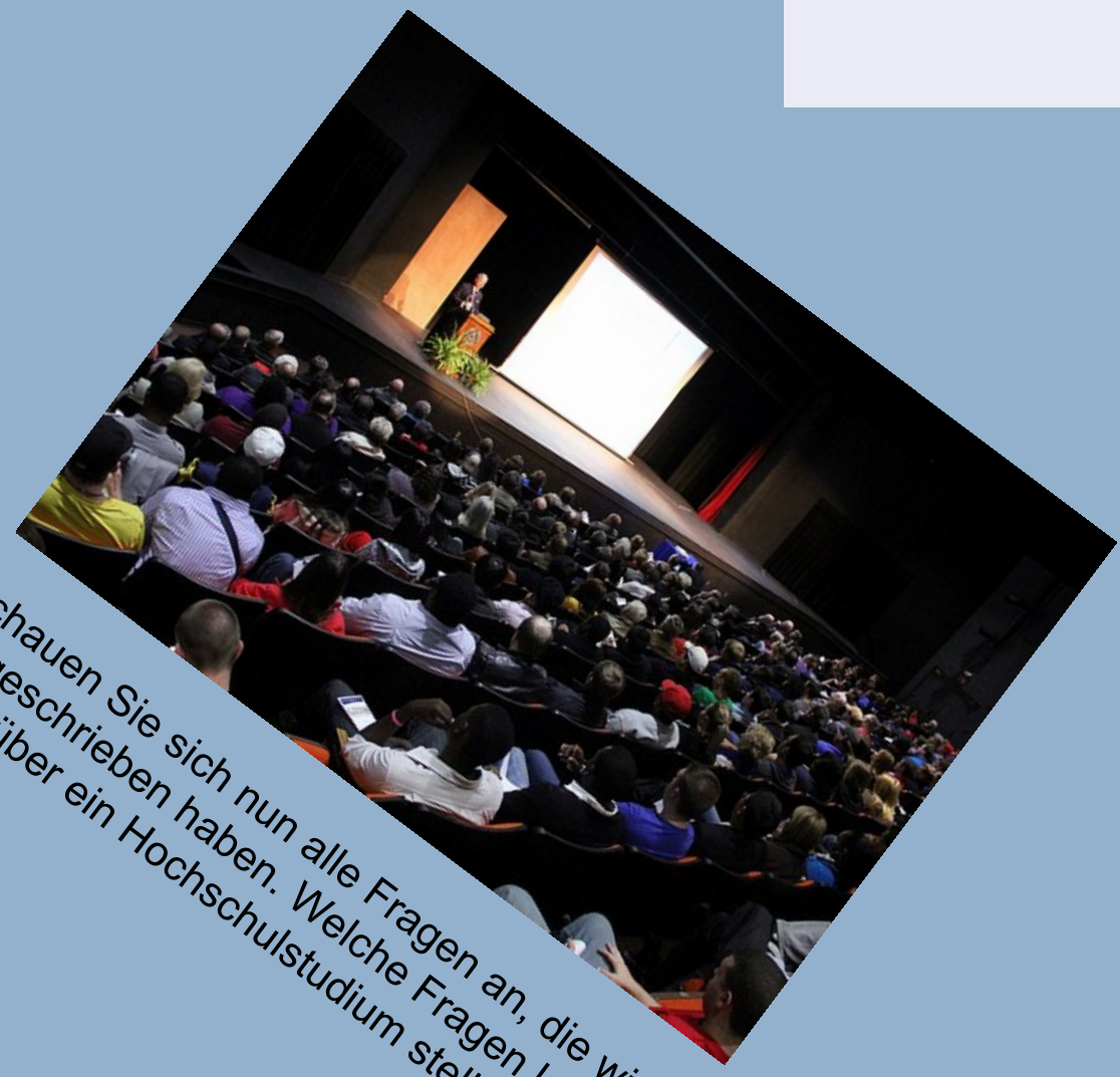
Schauen Sie sich nun alle Fragen an, die wir aufgeschrieben haben. Welche Fragen könnten Sie auch über ein Hochschultudium stellen? Fragen