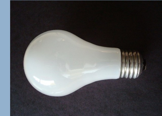
Ein guter Stromlieferant? Fragen