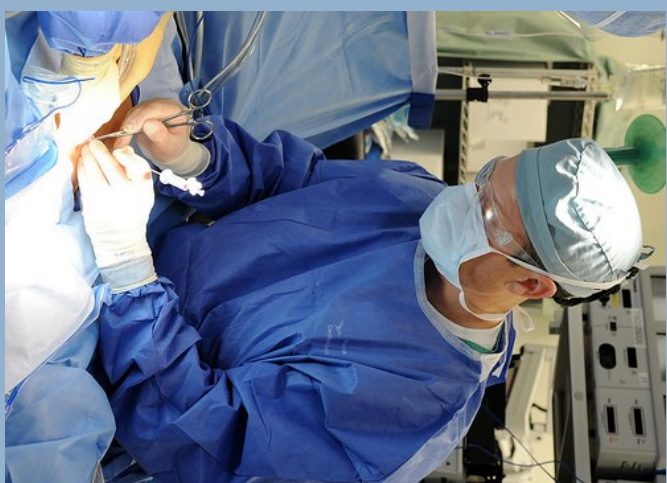
Ein gutes Krankenhaus? Fragen