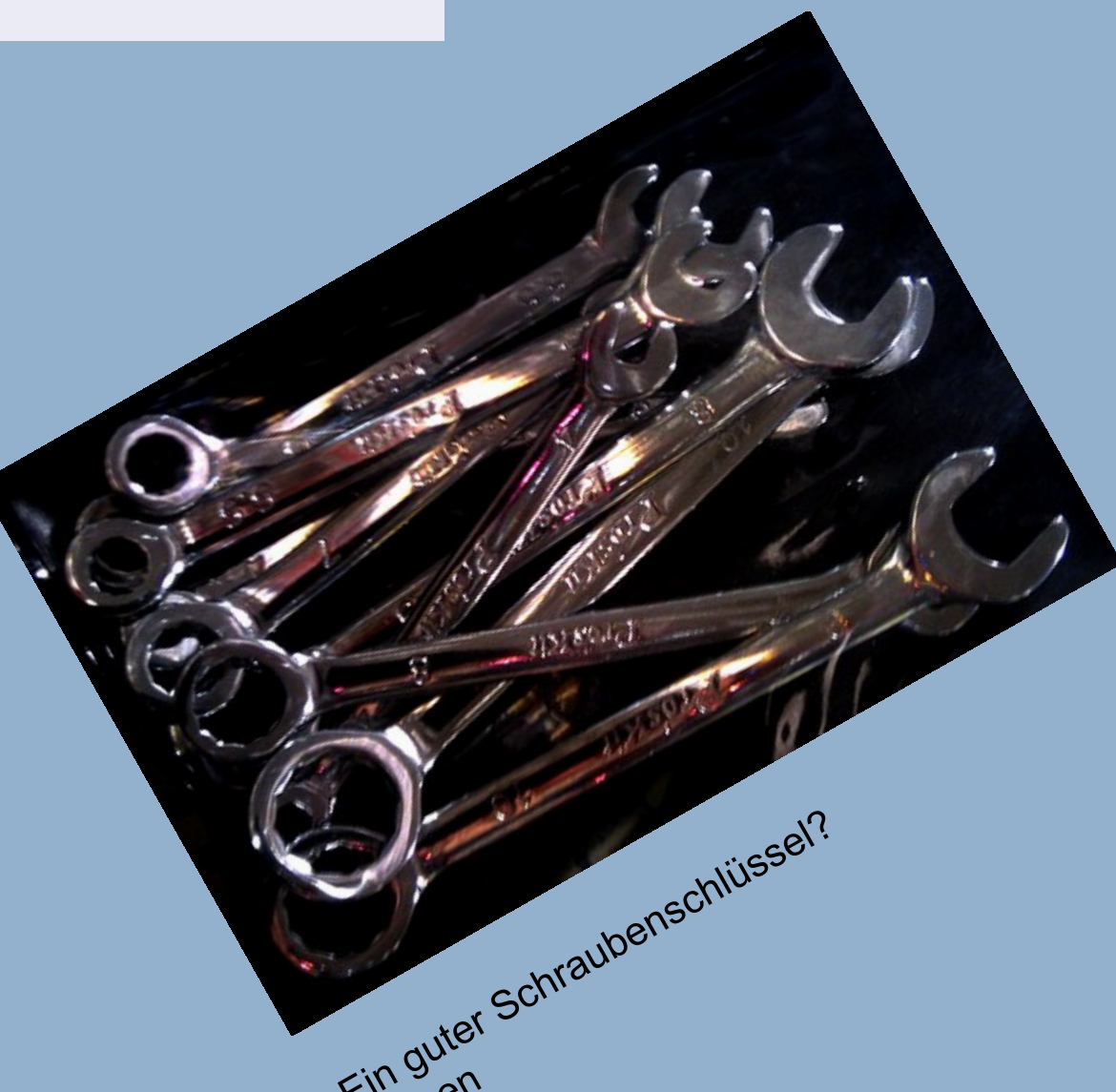
Ein guter Schraubenschlüssel? Fragen