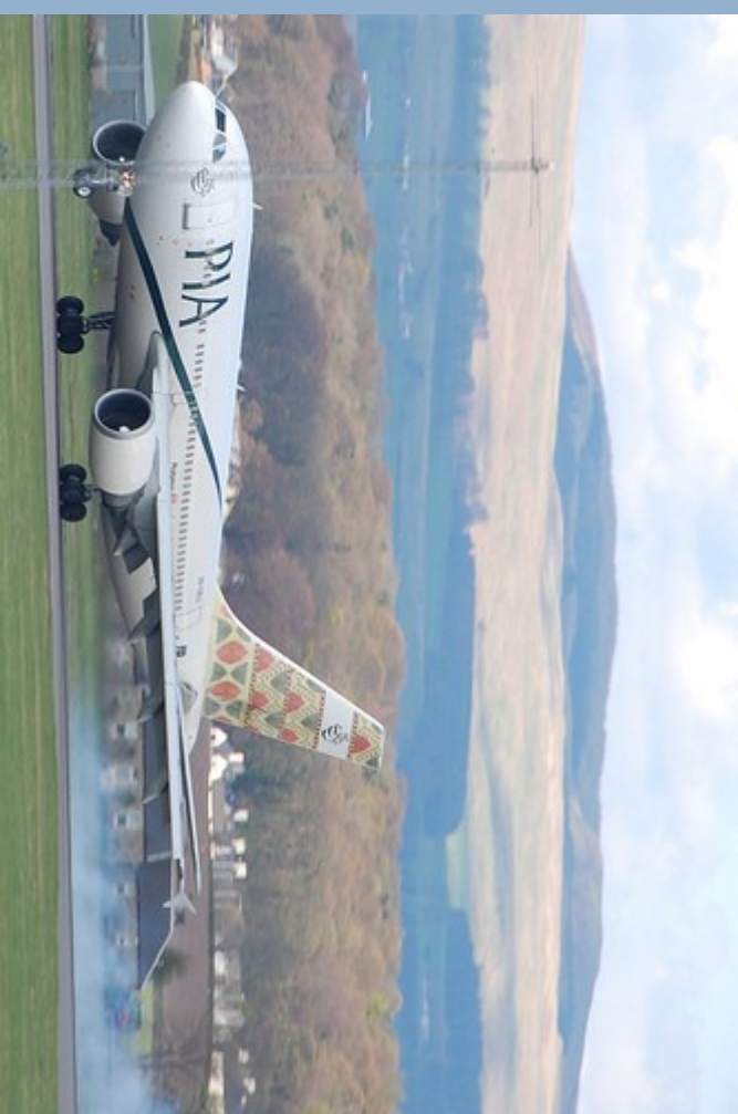
Ein gutes Flugzeug? Fragen