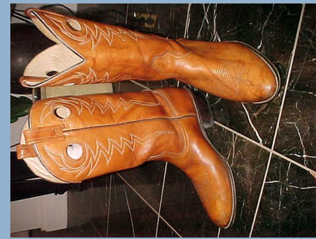
Ein gutes Paar Schuhe? Fragen