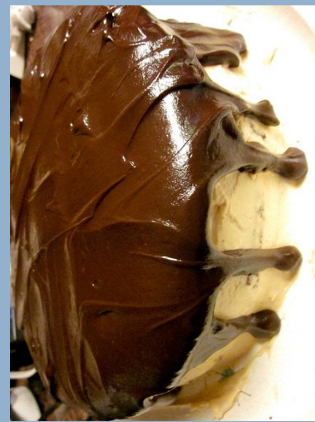
Eine gute Torte? Fragen